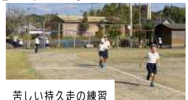
苦しい持久走の練習

学校では一年間の間にたくさんの学習発表の場があります。子供たちは、それぞれに目標を持って挑戦しています。できなかったことができるようになりたいという自分自身の成長を目指す子供もいますが、多くの場合は、発表会本番で少しでも成長した自分を一番身近な人に見てもらいたい、褒めてもらいたいという気持ちが大きいのだと思います。12月1日(木)には、持久走大会があります。どうしてもペースが上がり苦しくなる本番もおうちの人の声援できっと頑張れると思います。時間が午前中(10時25分から)ではありますが、時間の許す限りたくさんの方のみなさんの応援をお願いします。