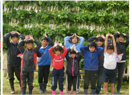
大根やぐらの前で

12月18日には、冷たい風を受けてできあがった立派な干し大根約1000本を収穫しました。子どもたちは収穫の喜びとともに、保護者や地域の方の協力に対し、感謝の気持ちを感じたようです。来年は大根やぐらライトアップイベントが笑顔で実施できるといいですね。