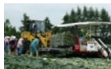
機械化体系の導入