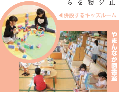
併設するキッズルーム