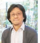
川越 宗一さん (錦江町生まれ)

錦江町生まれの直木賞作家 川越 宗一さん 京都からふるさと錦江町へメッセージ Profile 錦江町生まれ、大阪府出身。「天地に燦たり」で第25回松本清張賞を受賞して作家デビュー。2作目の「熱源」で直木三十五賞を受賞。京都市在住の42歳。