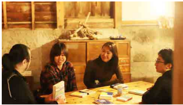
お気に入りや最近読んだ本を持ち寄って紹介する参加者。本がなくても気軽に参加して、話を聞くのも楽しみ方のひとつ。

「本と一筆」は、印象に残っている本やおすすしめたい本を紹介して語り合い、最後にガラスペンで一筆書くイベントです。20代から60代の方まで、幅広い年代の方が参加しています。本は一人で楽しむ方が多いと思いますが、誰かと本を共有することは、1冊の本を読む以上にたくさんさんの気づきや楽しさが生まれます。その楽しさをいろいろな人と分かち合いたいと思い、このイベントを始めました。