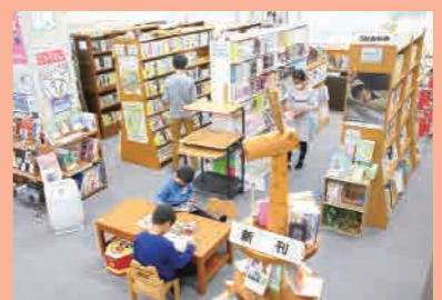
文化センター図書室

錦江町文化センター内にある図書室。今年4月から常設するパソコンで蔵書検索や予約もできるようになった。