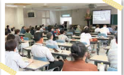
10月4日に開催された「川越 宗一オンライントークショー」イベントの様子は12ページに掲載。