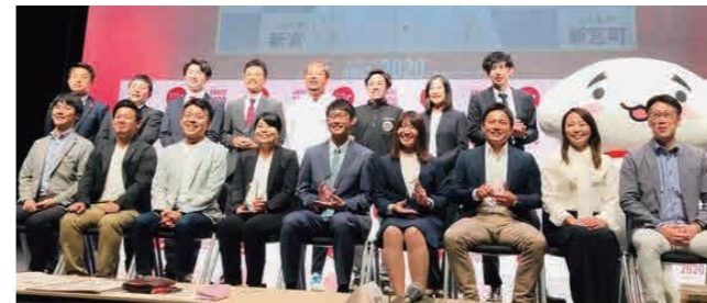
※ベストインベストメント賞▶ふるさと納税を投資的に活用し、未来につながるまちづくりを行っている「自治体」を表彰

本町のふるさと納税事業は、返礼品の豪華さやお得感ではなく、町や町内事業者の取組や想いに共感していただける支援者との関係を長期的に築いていくことを目的に運用しています。その一環として、町内に小児科専門医・産婦人科医がいない本町では、子育て世代が町内で安心して子育てできる環境を整えるべく、「ふるさと納税寄付金」を活用して、オンラインで小児科医・産婦人科医・助産師に無料相談できる「小児科/産婦人科オンライン」を導入しています。この活用方法が、「未来ヘツナグ」をテーマに開催された、ふるさとチョイスアワード2020で「ベストインベストメント賞」を受賞しました。