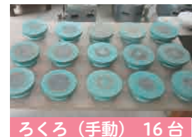
ろくろ (手動) 16台