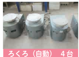
ろくろ (自動) 4台