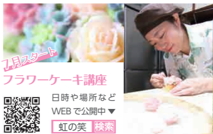
7月スタート フラワーケーキ講座 日時や場所などWEBで公開中 虹の笑 検索

ふるさと納税をきっかけに始まる新たな商品開発やセット企画、地元産品の活用、地域の盛り上がり。まちに眠る逸品が、全国へ誇る錦江ブランドへ。