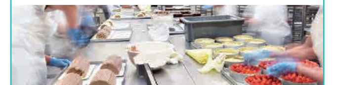
産業振興課 ☎ 22-3034