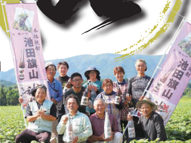
新たに「のぼり旗」も制作して新酒の販売がスタート