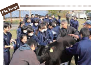
町内の中学3年生を対象に、毎年「畜産を学ぶ会」を開催しています。