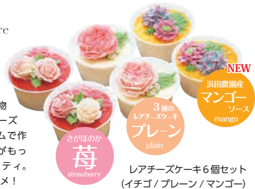
レアチーズケーキ6個セット (イチゴ/プレーン/マンゴー)

「旬彩創作 虹の笑」のパティスリー部門「Irisé Sourire (イリゼ・スリール)」が錦江町産の野菜や果物を使用して作るレアチーズケーキ。バタークリームで作る季節の花は食べるとおいしいほど高クオリティ。記念日や贈り物にオススメ!