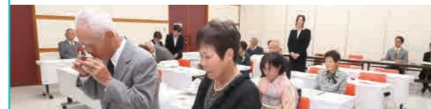
保健福祉課 ☎ 22-3042 / 住民生活課 ☎ 25-2511