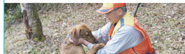
産業振興課 ☎ 22-3042 / 産業建設課 ☎ 25-2511