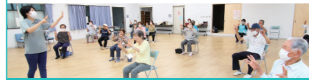
保健福祉課 ☎ 22-3030

時間 ▶ 両会場とも午前10時スタート 内容 ▶ イスに座ってできる体操など 持ってくるもの ▶ 室内履・飲み物・タオル等