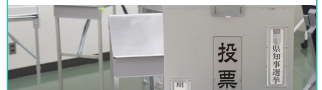
総務課 ☎ 22-0511