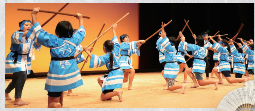
「上柴立棒おどり」次世代へ 伝統 を受け継ぐ

11月2日から3日にかけて、町文化祭と生涯学習大会が開催されました。3日の舞台イベントでは、舞踊やコーラス、民謡、ダンスなど日ごろの練習の成果を披露。夏休みにトワイライト事業で与論町を訪れた子どもたちによる報告会では、研修を通じて感じた「つながりの大切さ」について13名が発表しました。今回初めての参加となった神川地区の「田の神踊り」や、「上柴立棒おどり」など、長い歴史をもつ地域独自の郷土芸能も行われ、観客からは盛大な拍手が送られていました。ホール外では茶道教室によるふるまひ抹茶や、地元加工グループによる飲食ブースなど、味覚、食欲の秋を楽しむ姿も多く見られました。 また、総合交流センターや文化センターで2日間開催された作品展示では、写真や手芸、書道、児童生徒の作品など数多く展示。個性の光るこだわりの数々に、訪れた人は芸術の秋に触れた週末となりました。