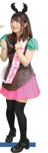
錦江くわがたガールズ (錦江町ふるさと大使)