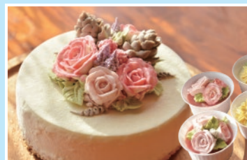
食材の新鮮さには 特にこだわっています

地元産の新鮮な食材にこだわった「虹の笑御膳」は月ごとにメニューが変わる(上) / 大人気の「お花紋リリアチーズケーキ」(下)