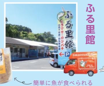
簡単に魚が食べられる

新鮮なヒラマサやカンパチの刺身、地元野菜、魚の加工品などを販売。レンジや揚げるだけで簡単に調理できる「さかしたキッチン」シリーズは人気。