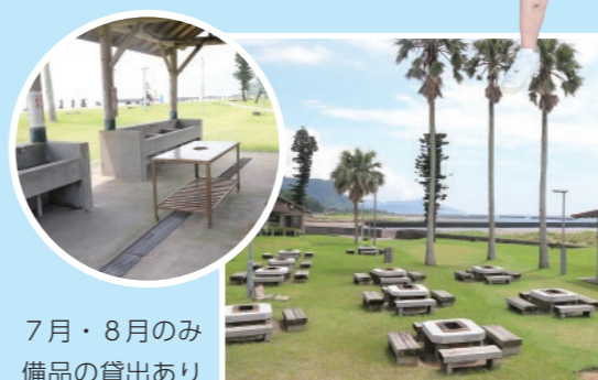
7月・8月のみ 備品の貸出あり