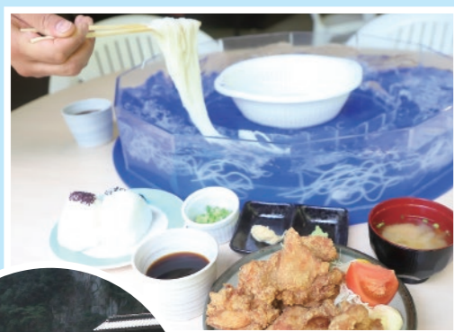
「そうめん流しBセット」 1500円(税別)