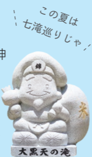
この夏は 七滝巡りじゃ！

幅 30 メートル、高さ 25 メートルの神川大滝。飛び散る水しぶきにはマイナスイオンがたっぷりなので、心も体もリフレッシュ！神川大滝のほかに、小滝など大小7つの滝があり、それぞれの滝に七福神が宿るといふ伝説も。