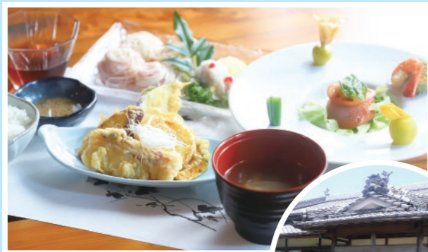
「虹の笑御膳」 1500円(税別)

地元産の新鮮な食材にこだわった「虹の笑御膳」は月ごとにメニューが変わる(上) / 大人気の「お花紋リリアチーズケーキ」(下)