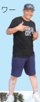
夏の始まりは レゲエ浜祭り！！