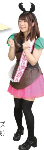
錦江くわがたガールズ (錦江町ふるさと大使)