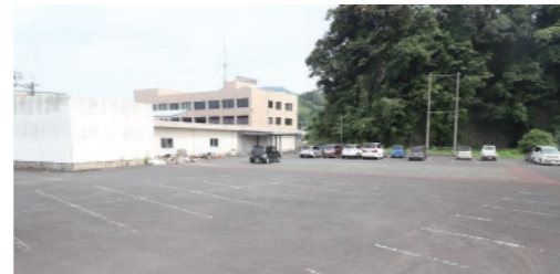
建設予定地 役場田代支所敷地内