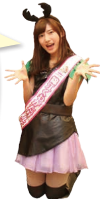
錦江くわがたガールズ (錦江町ふるさと大使)