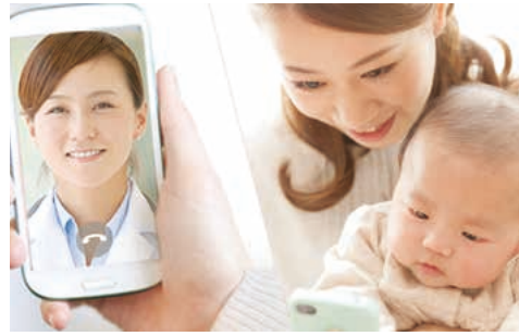
※遠隔健康医療相談のイメージ

錦江町では、日々育児を頑張っ ていらっしゃる町民の皆さまに安 心と希望をもって暮らして頂ける よう、子育て支援の更なる充実を 目指すべく、自宅からスマート フォンで小児科医に相談が出来る システムの実証実験を行います。 国内初となるこの事業は「錦江 町MIRAI」づくりプロジェクト の重要施策として位置付けられ ており、昨年度実施した町民全員 で未来づくりを考える政策提言 コンテスト「第2回未来想像・創 造コンテスト」において、「ふる さと納税寄付金の未来志向な使い