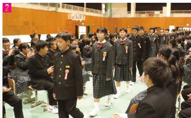
1 名前を呼ばれ元気に返事をする新入生 35 名 2 保護者や在校生に迎えられ堂々と入場