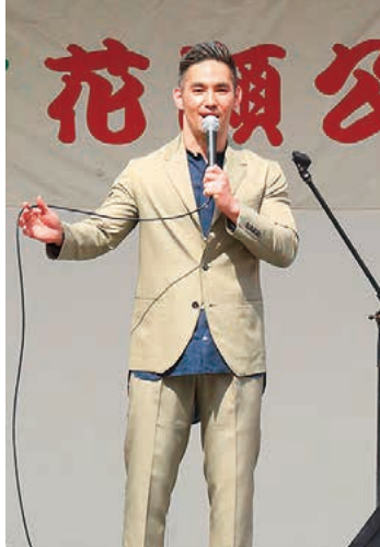
今年のメインゲスト。奄美出身の中孝介さんによるステージ。