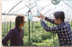
【実証実験：農業×IT】ハウス内環境の見える化と病害予測