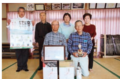
準グランプリ 神川新町自治会