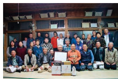
準グランプリ 川北自治会