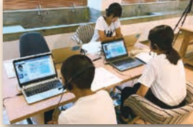
【実証実験：教育×IT】オンライン遠隔授業・タブレット教材学習

廃校になった旧神川中学校を部分改装したサテライトオフィスに、昨年 6 月～9 月の期間で 16 社（国内 14 社、海外 2 社、利用人数 45 名）に体験利用頂くとともに、町内の課題を解消するための実証実験や公営塾の実施にもご協力頂きました。