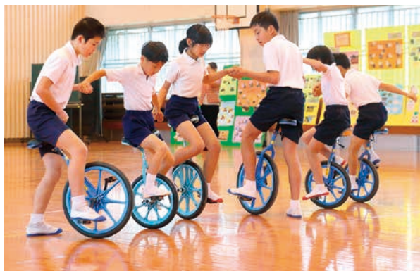
表彰式のあと一輪車の技を披露