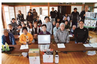
準グランプリ 京町自治会