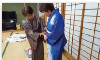
前結び・きの和装講座