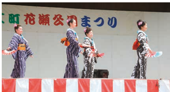
写真上：地元の方々による舞踊の披露

4月1日(日)、春の訪れを告げる恒例の花瀬公園まつりが開催され、5千人を超える観客でにぎわいました。今年も天候にも恵まれ、千畳敷の石畳で行われました。ステージでは田代地区の音楽グループ「ジョイサウンズ」の演奏に始まり、地元舞踊連の踊りやヒーローショー、バルーンショーなど大人から子どもまで盛り上がりついで