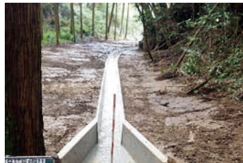
坂下用水路改修工事 事業費 3,790,800 円 (内交付金 3,500,000 円)

平成 29 年度電源立地地域対策交付金事業で、「坂下用水路」と「環境保全作業軽ダンプ」を整備しました。