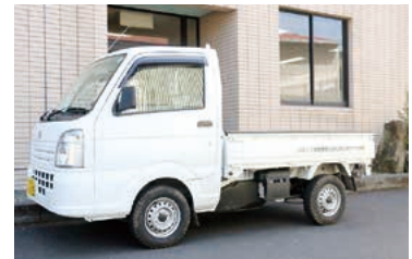
環境保全作業用軽ダンプ車 事業費 1,036,158 円 (内交付金 962,388 円)