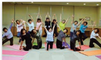
ストレッチヨガ講座