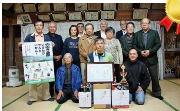
グランプリ 笹原自治会

コンテストは終了しましたが、空き家バンクへの登録は随時受け付けていますので、政策企画課までお問い合わせください。