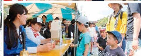
1 特産品や地元グルメが多数出店したフリーマーケット 2 「バルーンパフォーマーピッピ」ショーで大盛り上がりの子もたち 3 大原緑の少年団による募金の呼びかけ 4 特産品が当たるおたのしみ抽選会