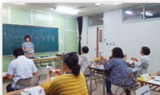
ハンゲル講座（初級）