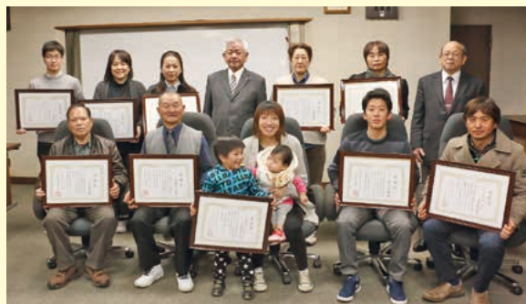
2月14日に行われた「第2回錦江町『未来』想像・創造コンテスト」授賞式及び百人委員会感謝状授賞式の様子