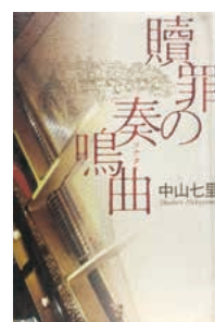
「贖罪の奏鳴曲(ソナタ)」 中山 七里 / 著

NHK大河ドラマ『西郷どん』の放送開始で鹿児島が注目を浴びる今、少しでも西郷さんについて知っておきたいと思っている方におすすめの本が『西郷どん！まるごと絵本』です。前半は、現代の子どもが過去にタイムスリップして、西郷さんと関わっていくという絵本になっています。後半は質問形式で、専門家の人が西郷さんの歴史をひも解いていきます。決して難しさはなく、とても分かりやすくなっています。子どもから大人まで楽しめる1冊です。