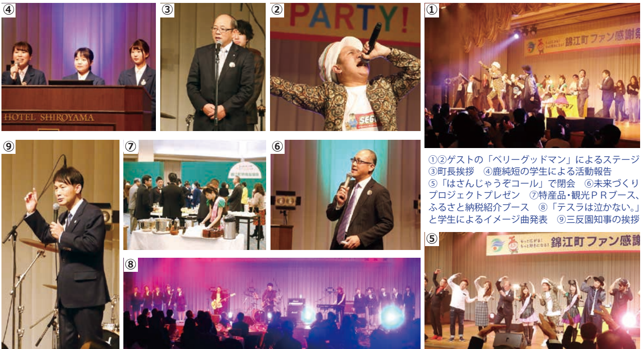
①②ゲストの「ベリーグッドマン」によるステージ ③町長挨拶 ④鹿純短の学生による活動報告 ⑤「はさんじゃうぞコール」で閉会 ⑥未来づくりプロジェクトプレゼン ⑦特産品・観光PRブース、ふるさと納税紹介ブース ⑧「テスラは泣かない。」と学生によるイメージ曲発表 ⑨三反園知事の挨拶