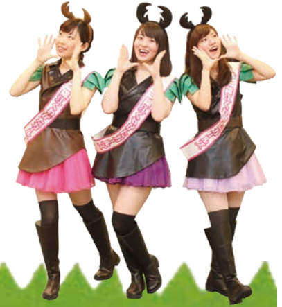
錦江町ふるさと大使「錦江くわがたガールズ」

平成17年3月に大根占町と田代町が合併して誕生した錦江町。 誕生からこれまでに、いろいろな取り組みのなかで多くの方たちに 応援してもらいました。 これまでの応援に感謝し、これからの錦江町をもっと「好き」になっ てもらいたい、もっと「楽しい」まちにしたいという思いから、『錦江 町FUN FAN CLUB』をつくりました。 これからも、FUN＝「楽しい」 FAN＝「好き」を合言葉に、まち の魅力を発信していきます。