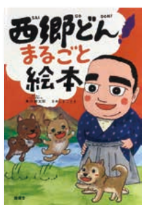
「西郷どんまるごと絵本」 東川隆太郎 さめしまことえ / 著