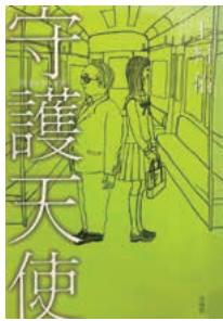
「守護天使」 上村 佑二 著

第2回「ラブストーリー大賞」受賞作。2009年、カンニング竹山主演で映画が全国公開されています。鬼嫁の尻にしかかれ、極貧生活をおくるダメオヤジ須賀啓一は、通勤電車で美しい女子高生に恋をしました。彼女が変質者に狙われていることを知った啓一は、彼女を守るため立ち上がります。審査委員も驚愕した爆笑ハートフルラブストーリーです。おすすめの一冊。