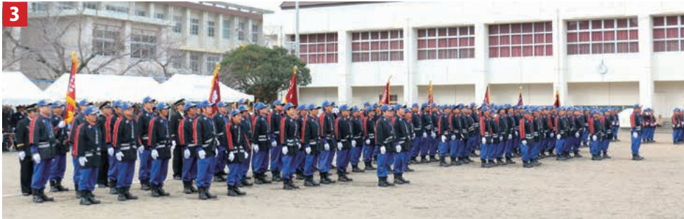
1 全分団による放水演習の披露 2 大根占市街地のパレードの様子 3 錦江町消防出初式の式典 4 法輪保育園幼年消防クラブ 5 操法訓練を披露する神川分団