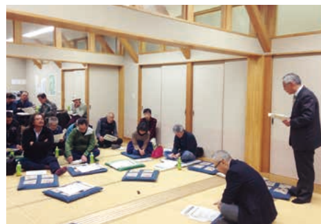
ニセコ町の「まちづくり町民講座」

なぜ住民と話し合いが必要なのか。役場と住民が同じ情報量であれば、ひとりひとりの知恵が加わり、まちをつくっていきけるのではないかとということが目的だからです。なので、住民との対話を1番に大切に、この20年間繰り返して行っています。