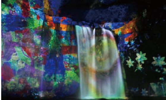
神川の自然をイメージしたプロジェクションマッピング

3月18日(土)、神川大滝公園でのライトアップイベントが行われました。公園内の小滝や橋がライトアップされ、縦30メートル幅25メートルの大滝には、CGを使って空間や建物に映像を投影するプロジェクションマッピングが施されました。神川の七滝伝説や風景に合わせた映像が流れると河原を埋め尽くすほどの人々から歓声が上がりました。