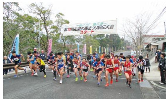
号砲と共に一斉にスタートした選手たち

3月19日(日)、花瀬公園まつり駅伝大会が開催されました。花瀬公園をスタートし、田代地区を一周する全長16.4kmのコースで、40チーム計280人がタスキをつなごうと走り切りました。