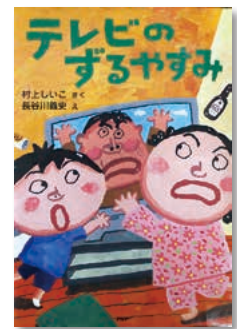
「テレビのずるやすみ」 村上 しいこ / さく 長谷川 義史 / え

ぼくのおすすめの本は、「テレビのずるやすみ」です。ぼくが、おもしろいとおもったところが、二つあります。