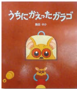
「うちにがえったガラゴ」 島田 ゆか / 作