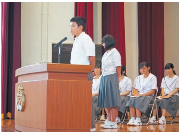
2年生3名，1年生8名の立候補者が演説を行いました。

9月26日(月)生徒会役員改選(立会演説会および投票)が本校体育館で行われました。