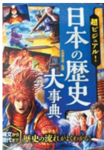
「日本の歴史大事典」 矢部 健太郎 / 監修