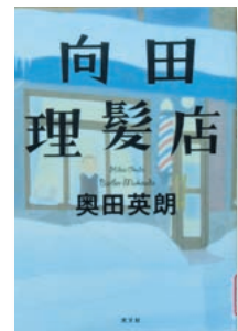
「向田理髪店」 奥田英朗 / 著

1941年に、太平洋戦争がはじまりました。そして1945年8月に広島と長崎に原子爆弾が落とされ20万人以上の方が亡くなっていきました。一人ぼっちになった子供たちは、12万人もいました。このページを読み、僕はとても悲しい気持ちになりました。もう、戦争がなくなってほしいと思いました。この本は、色もきれいで絵もたくさんありとても見やすいです。