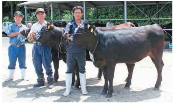
左から ひめこ号、かつひめ号、なかひめ 3号