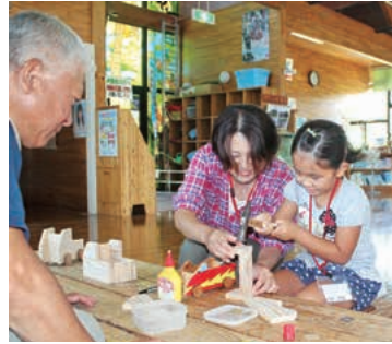
ビジターセンターで小物入れ作り

子どもたちの思い出にもなったようで、喜んでもらえてよかったです。とにかく無事に終わって安心しました。」とホームステイ受け入れを振り返っていました。