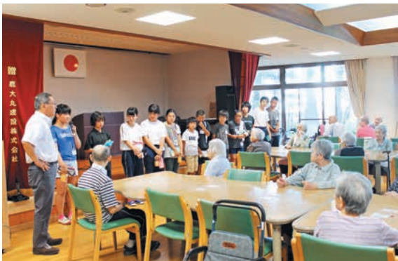
お年寄りに自己紹介する子ども達