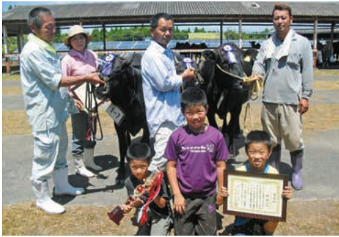
左から さかえ 59号、あやひめ号、さちはる 1号

今回は、9月9日に行われる肝属地区秋季畜産共進会へ出品する牛を両地区ともに12頭ずつ選定しました。