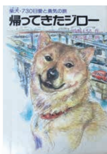
「柴犬・730日愛と勇気の旅 帰ってきたジロー」 綾野 まさる / 作