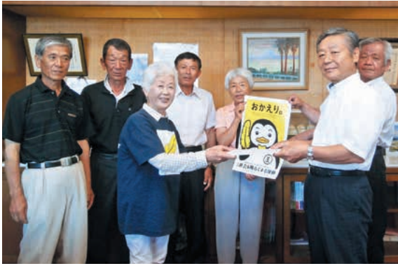
町長にメッセージ伝達する保護司の皆さん