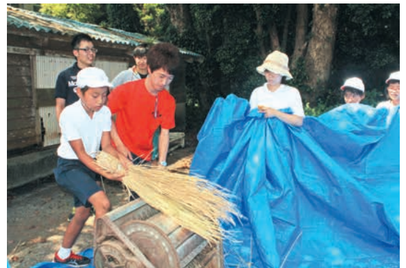
大学生と協力して足踏み式脱穀機を踏む児童

初日は足踏み脱穀の作業や唐箕 とうみ を使った藁くすと米の分別作業を大学生と一緒に行いました。夜には教室に畳をして眠るなど、いつもとは少し違う学校の雰囲気 ふういき に児童も「ドキドキする」「楽しい」と話していました。