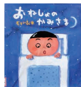
おねしょのかみさま 長谷川 義史 / 作

わたしは、おにいちゃんと夏休みは、やまんなか図書室で勉強をしました。本もたくさん読みました。しょうかいする本は、「おねしょのかみさま」です。ゆうちゃんが、おねしょをすると、ふとんからおねしょのかみさまが出てきておどります。毎日、ゆうちゃんがおねしょをするから、毎日、おねしょのかみさまが、出てきておどりをすると、おまじないのことばがおもしろかったです。