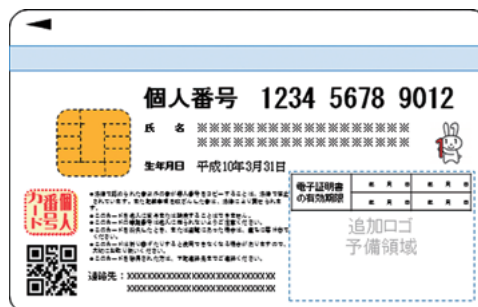
個人番号カード裏面 (案)