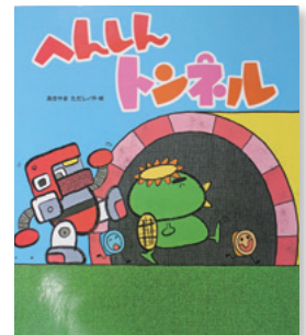
へんしんトンネル あきやま ただし / 作・絵

皆さん覚えていらっしゃるでしょうか？薬害サリドマイド児（両腕がない）として生まれ、映画にもなり衝撃を受けました。