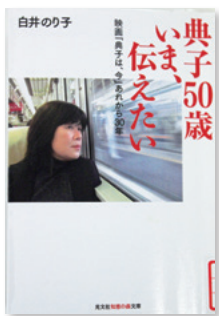
典子 50歳いま、伝えたい 白井のり子 / 著