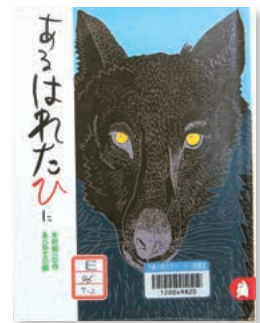
あるはれたひに 木村 裕一 / 作