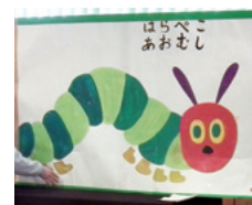
（平成 25 年度 読書まつりより）