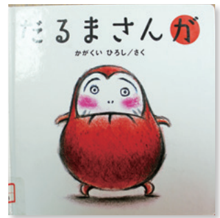
「だるまさんが」 かがくいひろし / 著

読み始めた時は、こんなことはないだろうと思っていたら、これに似た事件が、京都で現実起こっていました。