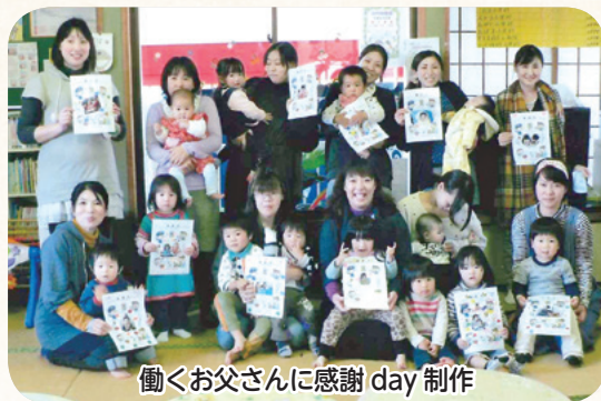
働くお父さんに感謝 day 制作