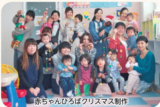
赤ちゃんひろばクリスマス制作

各月行事 (もちつき 父の日・母の日など) あそびの広場 はじめてお母さん バスでお出かけ 自由遊び お誕生会 リフレッシュ講座