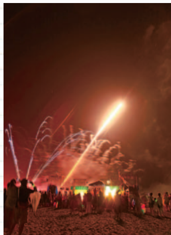
最後の花火は会場全体が大いに盛り上がりました。