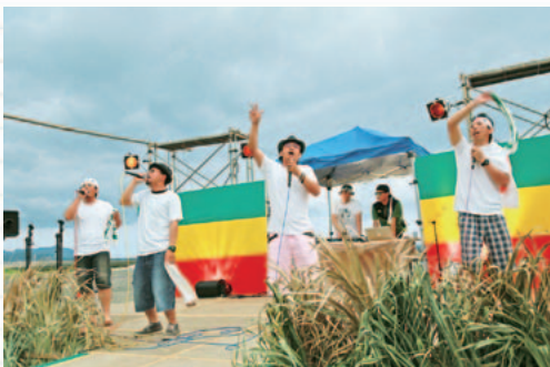
会場を大いに盛り上げる錦江乃風