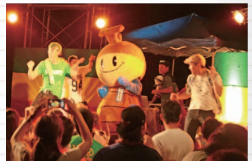
でんしろうもステージで華麗なダンスを披露しました。