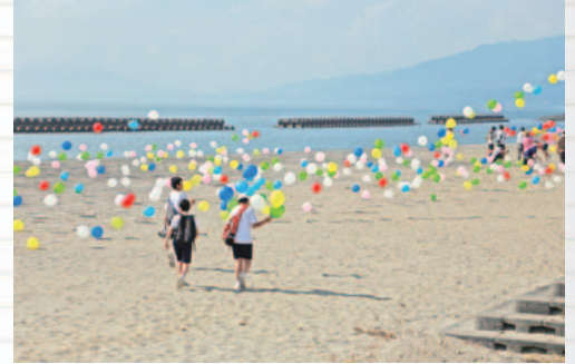
スポーツ少年団・神川地区公民館の皆様を中心に約1000個のLED風船を設置