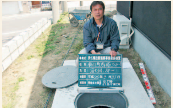
浄化槽設置事業検査の様子

そのため、錦江町では生活排水対策のため、既存の単独処理浄化槽・汲み取り便槽からすべての生活雑排水をきれいにする合併処理浄化槽へ設置かえをする方のために、補助金を交付する制度を設けており、多くの方が利用されています。また、錦江町の場合は、国の制度を有効に利用し通常、5人槽が332千円、7人槽が414千円、10人槽が548千円ですが更に100千円の上乗せがあり大変有利です。