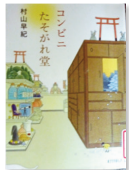
コンビニたそがれ堂 村山 早紀 / 著