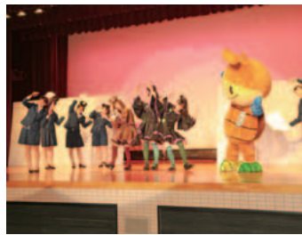
クワガタガールズのリニューアル した衣装のお披露目

までクワガタガールズの衣装制作やスイーツの共同開発などを手掛けてきました。 今後は純心女子短期大学の各学部と連携し、教育振興や農産物を活用した特産品開発や食育に取り組み、地域の活性化に繋げていきたいと思えます。