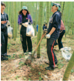
米作り体験と 竹の子掘り体験