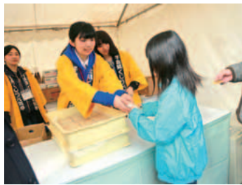
共同開発したスーツの販売