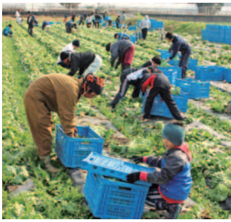
子ども育成部のレタス収穫

産業部では、農地・水・環境保全向上対策事業に取り組み、農用地水路・農道等の草払い