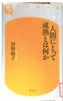
人間にとって成熟とは何か 曾野 綾子 / 作