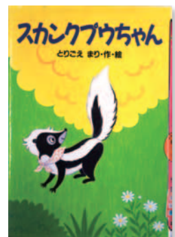
スカンプウちゃん とりこえ まり / 作・絵

あんな風に年を重ねられたらと、思える人に出会ったら幸せな気持ちのなります。人間は十人十色で自分の心が乱されてしまう相手に出会うこともあります。この本は、本人の心で流してしまう、自分らしく生き抜くコツが提言されています。周りに振り回され自信をなくしそうな方、どうぞ読んで見て下さい。