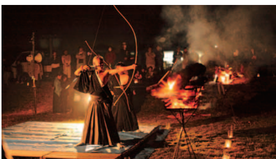
家内安全を祈念しての大的始会

麓地区公民館は、10自治会で公民館活動を行っています。2月3日には恒例の「せつがい」を行いました。1月26日に各自治会で協力して約15mの竹のやぐらを組み、2月3日は、弓道愛好家による無病息災、家内安全を祈念しての大的始会のあと、立志式を迎えた中学2年生、厄年、還暦、古希を迎えられた人によってやぐらに火が付けられました。会場では、子ども会育成会によるぜんざいのほか、焼酎などがふるまわれ多くの人で賑わいました。