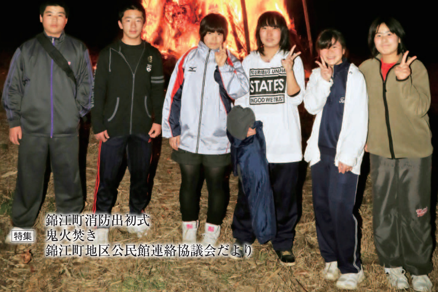
錦江町消防出初式 鬼火焚き 錦江町地区公民館連絡協議会だより

花瀬地区では5自治会が集まり、毎年鬼火焚きを行っている。 この地区の中学生や還暦を迎えた方が中心となり、たいまつで点火したあと、還暦・厄年を迎えられた5名の方々が餅まきを行った。