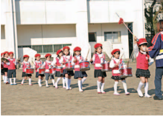
法輪保育園児による演奏

平成26年1月5日、錦江中学校グラウンドにおいて錦江町内の各消防団員や関係者が集まり、消防出初式が開催されました。