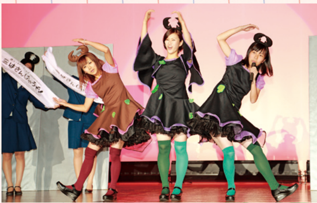
リニューアルした衣装で登場したクワガタガールズ「はさんじゃうぞ」

10月26日、でんしろくんの妹、「クワガタガールズ」のリニューアルした衣装発表が鹿児島純心女子短期大学で行われました。今回のリニューアルは純心短大との共同コラボ企画として、冬でも寒くないようポンチョの制作や動きやすいよう改良を重ね、約5ヶ月をかけ制作し、学園祭に合わせて発表となりました。 またこの日は、ヤナギムラ・純心短大・錦江町・ソラシドエアのスイーツのコラボ商品「生クリームアップルパイ」も大好評でした。