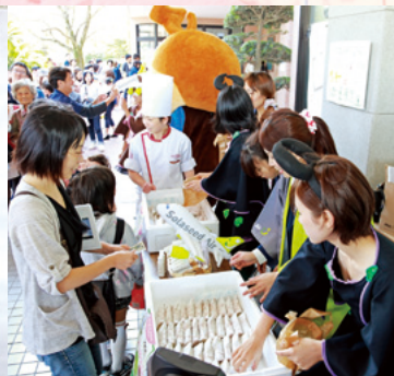
コラボスイーツを販売するメンバー