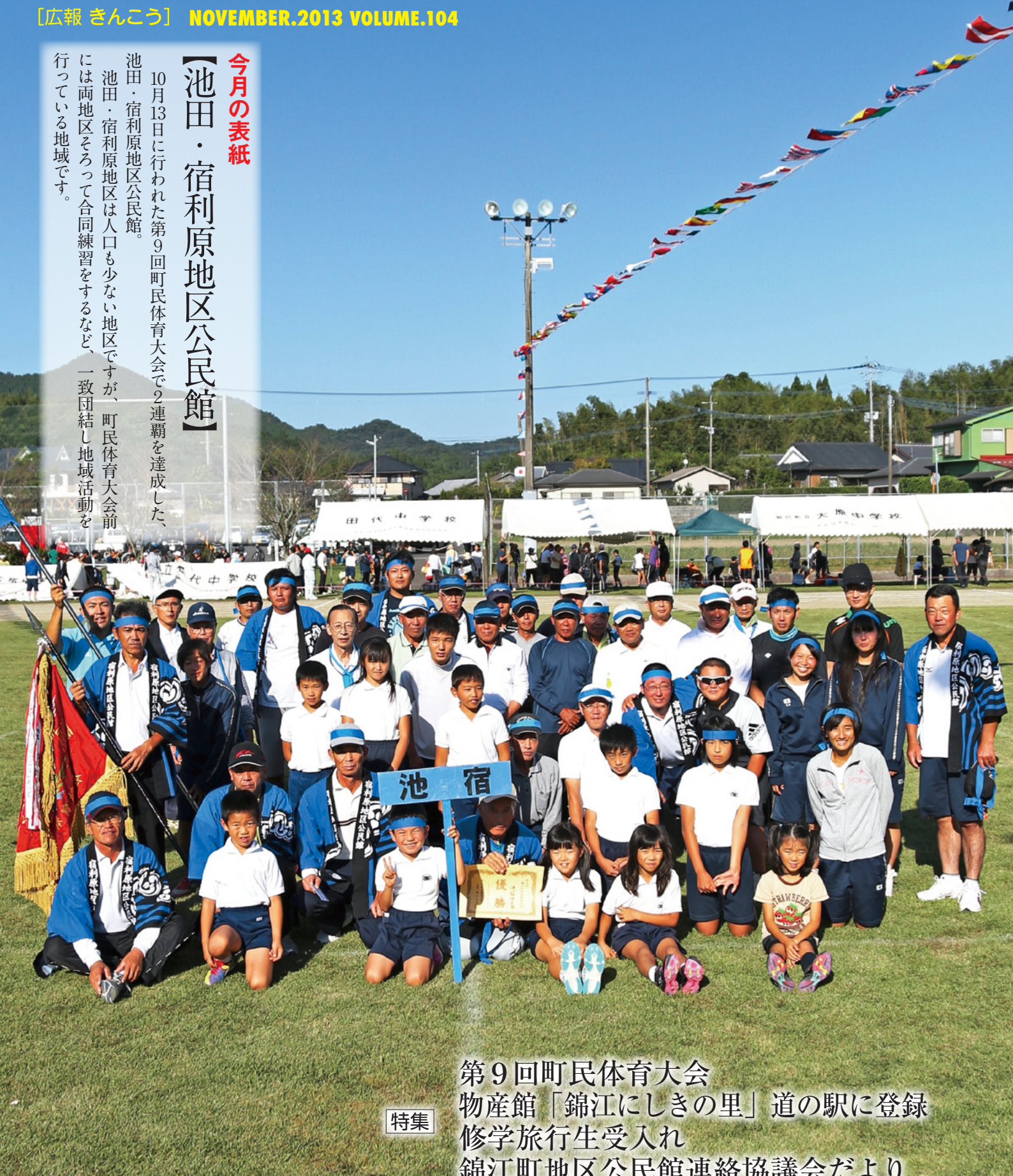
第9回町民体育大会 物産館「錦江にしきの里」道の駅に登録 修学旅行生受入れ 錦江町地区公民館連絡協議会だより

池田・宿利原地区は人口も少ない地区ですが、町民体育大会前には両地区そろって合同練習をするなど、一致団結し地域活動を行っている地域です。