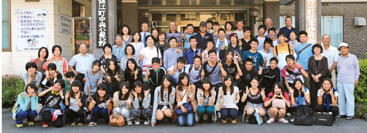
大阪府立寝屋川高等学校の皆さんと受け入れ家庭

錦江町ツーリズム協議会では、10月8日～10日に大阪府立寝屋川高等学校、10月22日～24日には大阪府立刀根山高等学校の民泊型教育旅行（修学旅行）の受け入れを行いました。この事業は農山漁村生活体験や交流を目的として行っており、各家庭では、農作業体験やそば作り体験、団子作りやみそ作り体験など様々な体験を行いながら交流を行っていました。なかには、生産しているお茶を使い紅