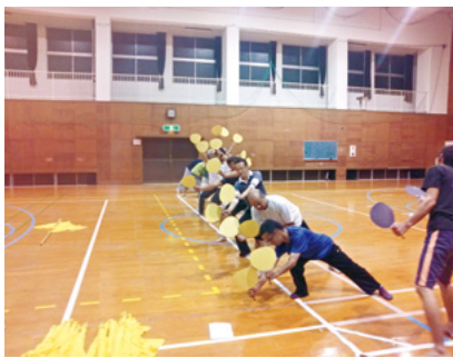
運動会の練習の様子

町民体育大会の種目に応援合戦が入つてからそのたびに協力してもらえそうなるに声掛けして人集めをしていた。一二年目はそれなりに集まつてくれたが次第にみんなだれてくる。三日三月三年というけれども三年目が何もかも難しい。たつた三分の演技だが準備からこれ一月は要する。それほど大きなエネルギーを必要とする種目なのである。神川は21年