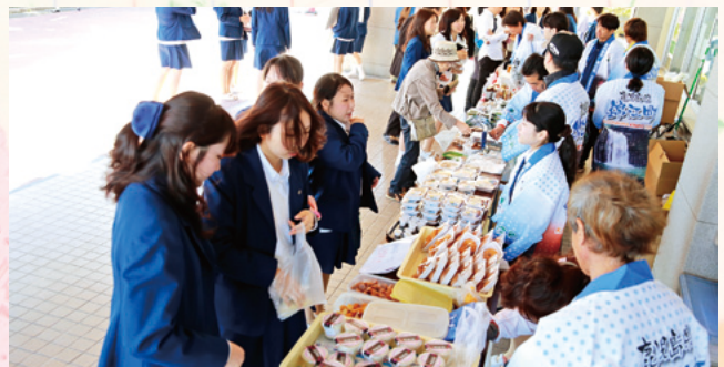
錦江町特産品協会の特産品も好評でした。