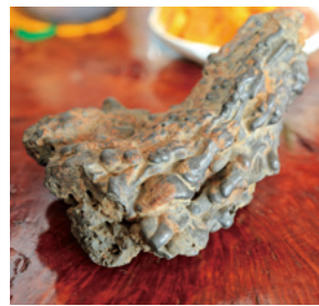
庭の畑から出てきた 鉄くずの固まり

なぜこの地に人が住み着いたか、商 店街が賑わっていたか、製鉄所があっ たかなど次の世代の若者達に錦江町