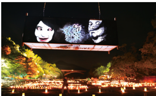
やまんなか音楽会に展示した様子

先月開催された、町民体育大会では、花瀬地区は川原地区と合同の「川原チーム」で参加しました。川原チームは最下位が定位置のチームでありましたが、今年「やられたらやり返す！川原返すだ！」を合言葉に奮闘しました。その結果、初の総合3位入賞で川原返しを果たすことが出来ました。