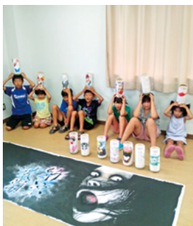
子ども和紙灯籠と、ジャンボ灯籠イラスト

れました。花瀬地区公民館からも、和紙を使った竹灯籠や、ジャンボ灯籠を制作してイベントを彩り、ジャンボ灯籠を観た来場者は「じえいじえい」と連呼されておりました。