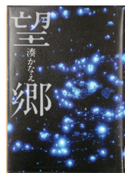
「望郷」 湊 かなえ / 作

テレビやCMでのセリフ「いつやるの？今でしょ！」等で一躍「時の人」になった東進ハイスクール林先生の最新刊です。40の習慣の中には、「努力はベクトル量だ」や「夢や希望は語ってしまえ」、「愚痴や不満を言わずそれを利用せよ」など、読者の背中を押してくれる内容が豊富です。最後の「人税のアイウエオを胸に抱いて生きている」も人生の参考になります。お薦めです。