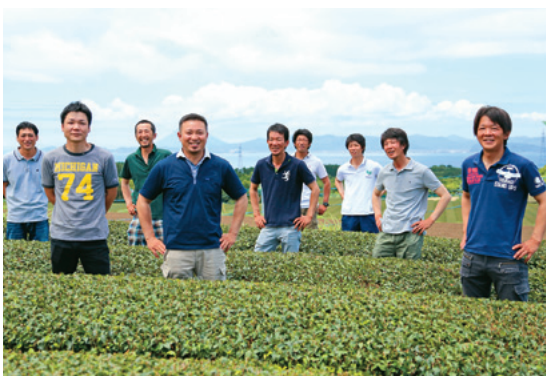
ふかみ会のお茶も機内でいただけます（期間限定）