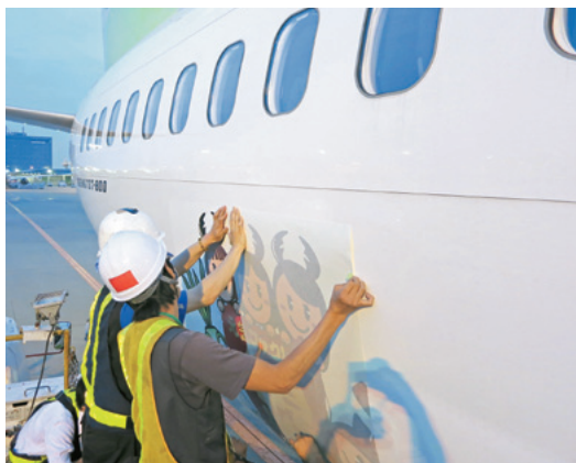
デカール貼付作業の様子（羽田空港）

意味：「夢に届くまで翔べるだろうか、翔べないかもしれない、でも迷って泣くぐらいなら、思い切って翔んでしまおう!!」