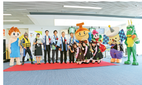
大隅半島一体となり地域を盛り上げていきます。

機内では、キャビンアテンダントがでんしろくンデザインのエプロンを着用しています。エプロン販売も行う予定です。