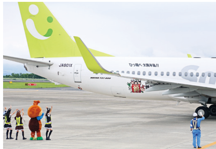
元気ファクトリー錦江町号をでんしろくんとクワガタガールズで見送りました。

事業費はデカール作成費（航空機の外に貼ってあるシール）が一年間で、約 160 万円（うち半分は県補助）のみです。機内でのお茶の提供や機内誌による観光地や特産品・農産物をPRすることにより、これまでにない経済効果が期待できます。