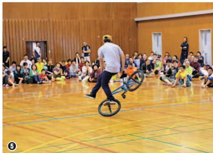
⑤ プロ BMX ライダーのパフォーマンス ⑥ 鹿屋農業高校生による和太鼓演奏