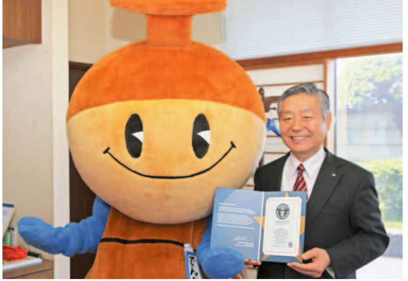
先日、イギリスから届いたギネス認定証