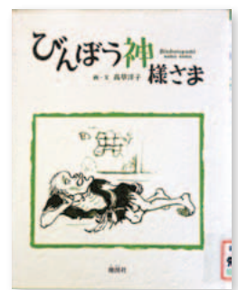
びんぼう神様さま 高草 洋子 / 画・文