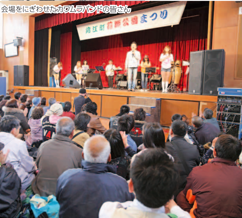
会場をにぎわせたカワムラバンドの皆さん