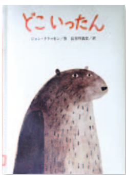
どこいったん ジョン・クラッセン / 作 長谷川 義史 / 訳