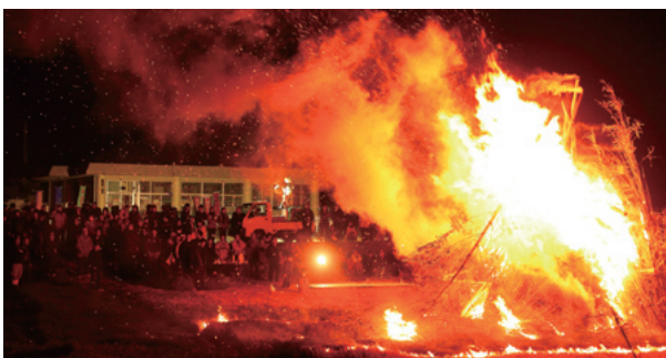
大勢の方が楽しみにしている鬼火焚き

2月3日には恒例の「せっがい」を行いました。1週間前に各自治会で協力して約15mの竹のやぐらを組み、当日は、田代地区で活動する鼓友会の太鼓演奏が始まり、弓道愛好家による無病息災、家内安全を祈念しての遠的のあと、立志式を迎えた中学2年生6名によってやぐらに火が付けられました。会場では、子ども会育成会によるぜんざいのほか、焼酎などがふるまわれ多