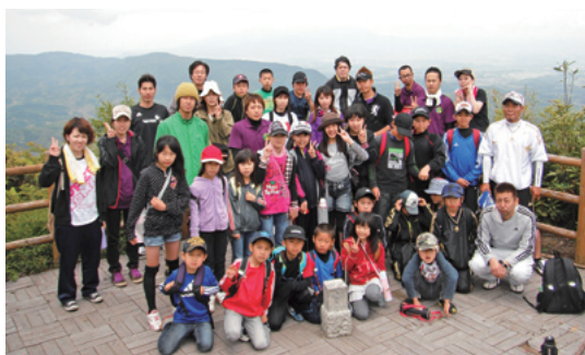
八山岳頂上にて「ハイポーズ!!」

女性部は、先月2月17日（日）に文化センターで女性部の集いを行いました。当日は35