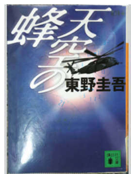
天空の蜂 東野 圭吾 / 著

この本は、さらわれたひいじいちゃんを間違いを探しながら見つけていく話です。どんどんレベルが上がって行って退屈しません。この本のほかにも色々なゲームのシリーズがあるので、ぜひ挑戦してみてください!