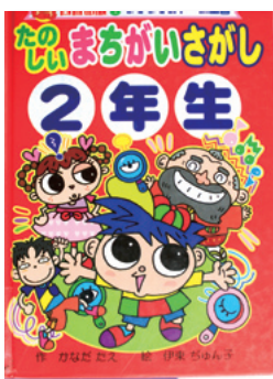
たのしいまちがいがし2年生 かなだたえ / 作 伊東 ちゆん子 / 絵