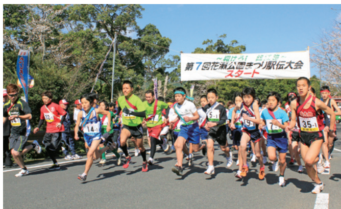
※ 写真は昨年(2012)の状況です

花瀬公園をスタートし、田代地区を1周7区間に分かれ競い合う駅伝大会。町内外から約50チームの参加があります。