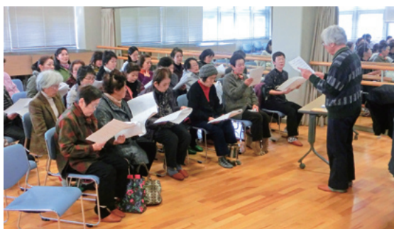
♪ゆ〜めが広〜がる〜錦江町戸