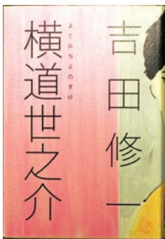
横道 世之介 吉田 修一 / 著