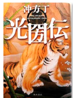
光圀伝 沖方 丁 / 著

長崎の田舎から大学進学のために上京し、青春を謳歌しながら毎日過ごしている『横道世之介』というある一人の青年の物語です。お調子者で、こいつに関わると面倒くさいんだよねあとと思ながらも、見捨てられない奴…そんな友達っていませんか？そんな世之介に関わった人々の話です。ちなみに、今年2月に高良健吾主演で映画公開されるそうです。