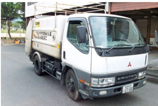
塵芥車 254,910km H 13.2