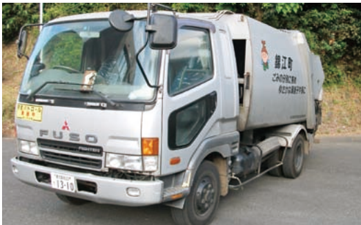
塵芥車 140,762km H 12.3