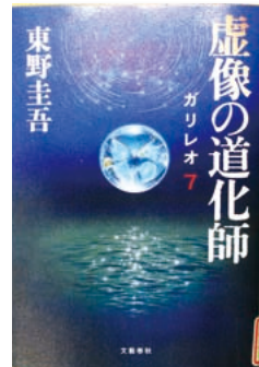
虚像の道化師 東野 圭吾 / 著

日本人のルーツはこの九州の倭の国々からはじまった。二百年受け継がれた一族の三つの教え、すべては平和につながる。