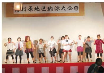
婦人部によるAKB48（宿利原地区）