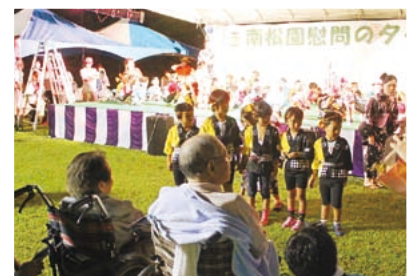
園児による盆踊り（南松園）