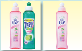
①ファミリビューアセット ②ファミリビューア

簡素化の傾向ですが、お茶の代わりに差し上げてみてはいかがでしょうか？ （ノシ、包装・袋をつけてお届け）