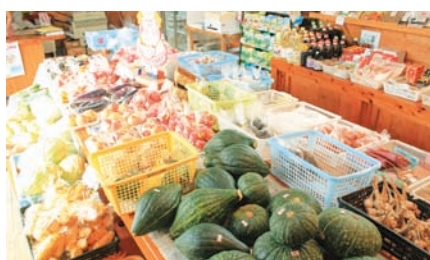
こだわりの食材が並ぶ