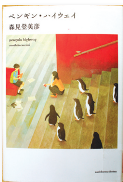
ペンギン・ハイウェイ 森見 登美彦 / 著