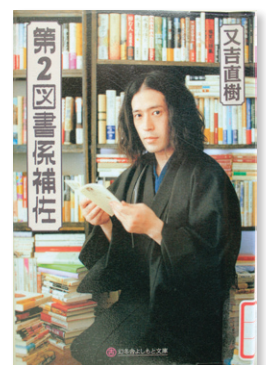
第2図書係補佐 又吉 直樹 / 著

お笑い界イチの読書家! 週に10冊ペース(これは凄い!) 名作品を紹介しながら自分とのエピソードを面白おかしくつづった本です。 ※僕は本によって助けられたことは、数知れません。(本文より) 本選びや読書の楽しみ方など満載です。紹介された本ぜひ読んでみたいと思います。