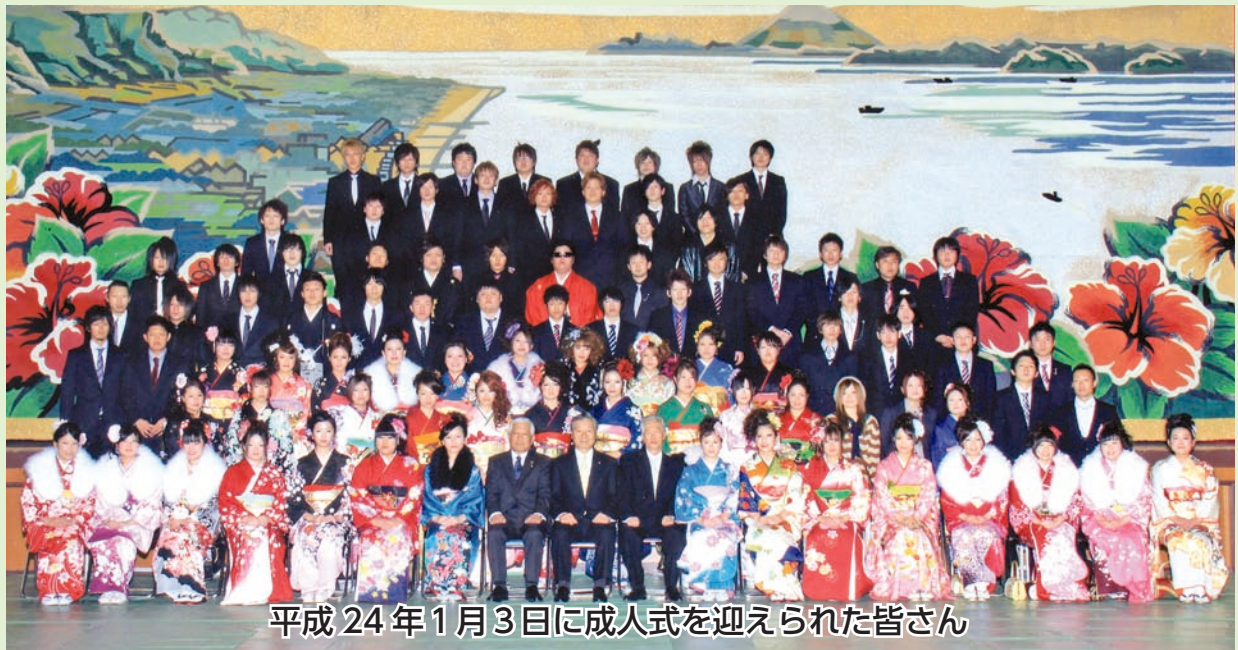
平成24年1月3日に成人式を迎えられた皆さん

今年度錦江町では、133人の方々成人式を迎えられました。1人でも多くの若者が錦江町を担う住民としてがんばってほしいものです。