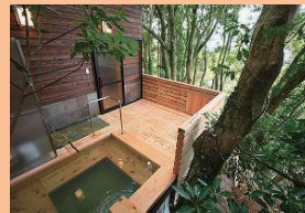
天珠の館 露天風呂

さらに、隣接する宿泊施設「天珠の館」には、温泉スパ施設や健康増進をサポートする運動施設、遊歩道も整備されています。治療中はふさがちな気持ちを癒していただける施設です。