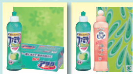
①アタック 300mg ファミリーセット ②ファミリーピュア セット

簡素化の傾向です。 300円前後の商品はいかがでしょうか？ (ノシ、包装・袋をつけてお届け)