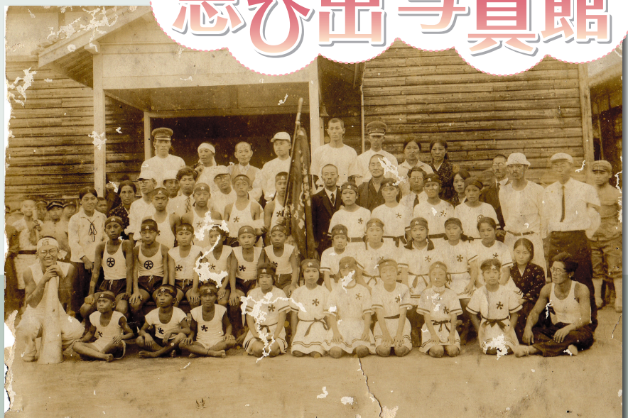
優勝をした喜びの表情や自信に満ちた表情がうかがえる一枚