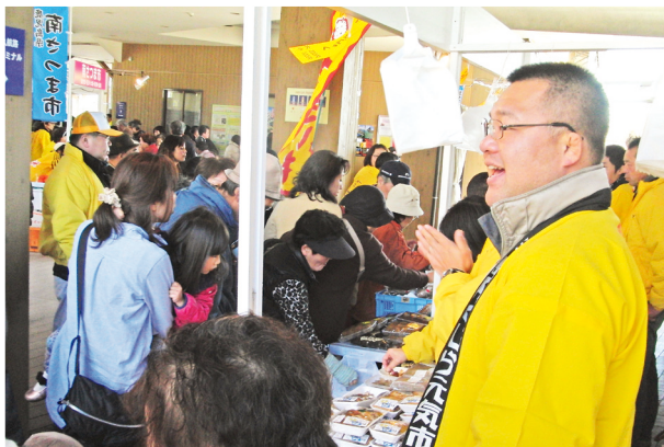
オープン前からお客さんで溢れた会場

このような、販売者とお客さんの両方の顔が見えるイベントは今後本町をPRしていく上で、とても大切なことだと感じます。