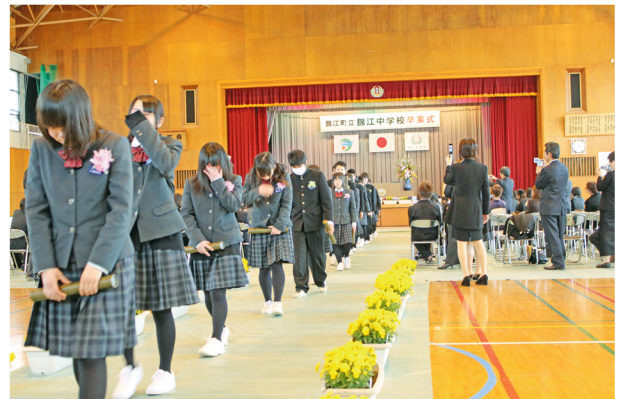
涙をこらえ学び舎を巣立つ生徒達