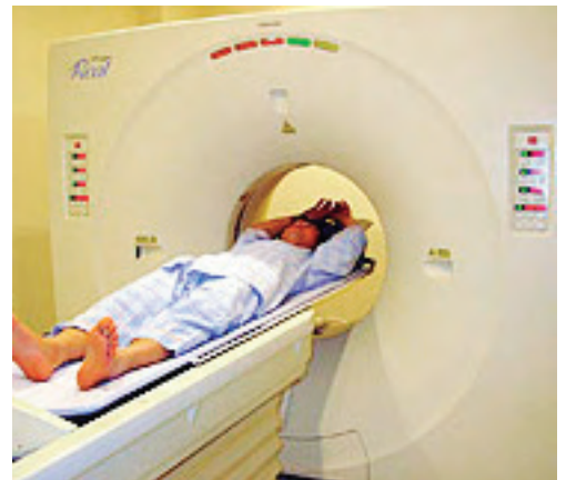
肺がんCT検査(イメージ図)