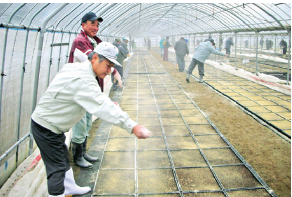
豊作祈願をしながら播種を行う参加者