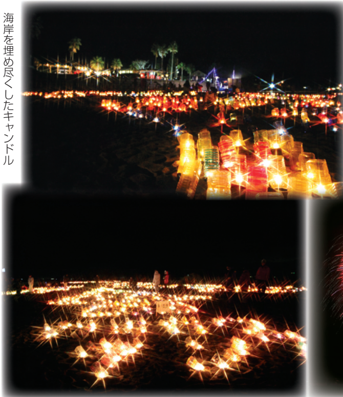
キャンドルアートの中を歩く来場者