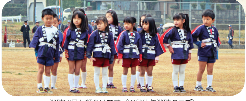
消防団員も顔負けです (田代幼年消防クラブ)