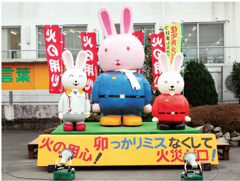
南部消防署製作の防災啓発オブジェ