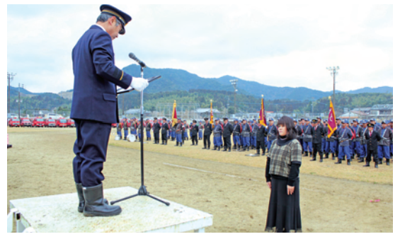
25年勤続妻・家族の表彰