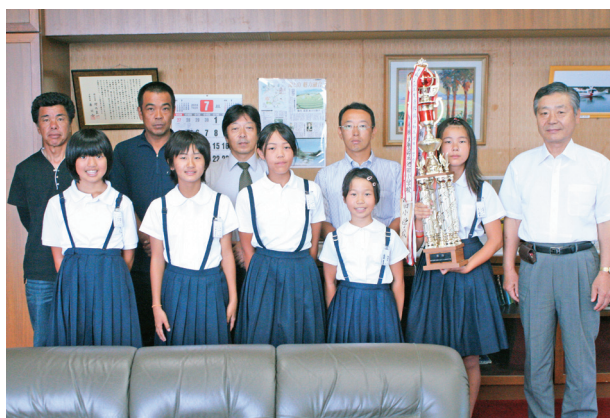
喜びの優勝報告 (役場町長室)

池田小学校の池田自転車クラブが県大会で6連覇を達成し、見事、第45回交通安全子ども自転車全国大会への切符を手に入れました。