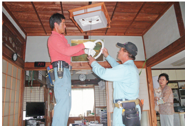
手際良く蛍光灯を取り替える隊員