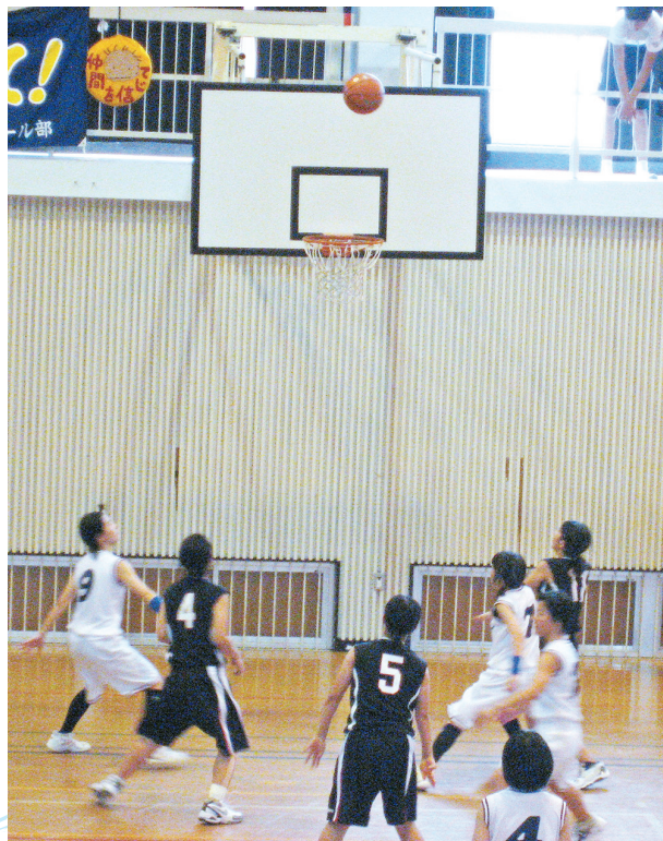
▲ ボールの行方を追う選手たち