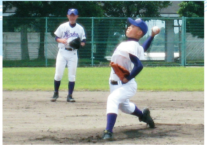
▲ バックを信じて投げる渾身のストレート