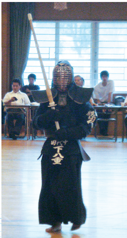
◀ 防具の上からでも伝わる気迫