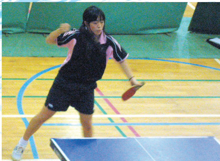
◀ 展開の早い卓球。集中力もすごいです。