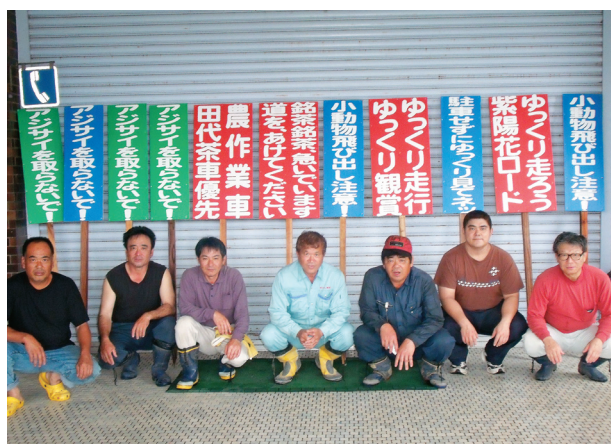
すがすがしい汗をかいた後でパシャリ