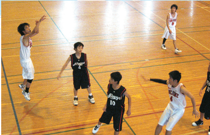
▲ 決まれ! 狙い澄ましたシュート