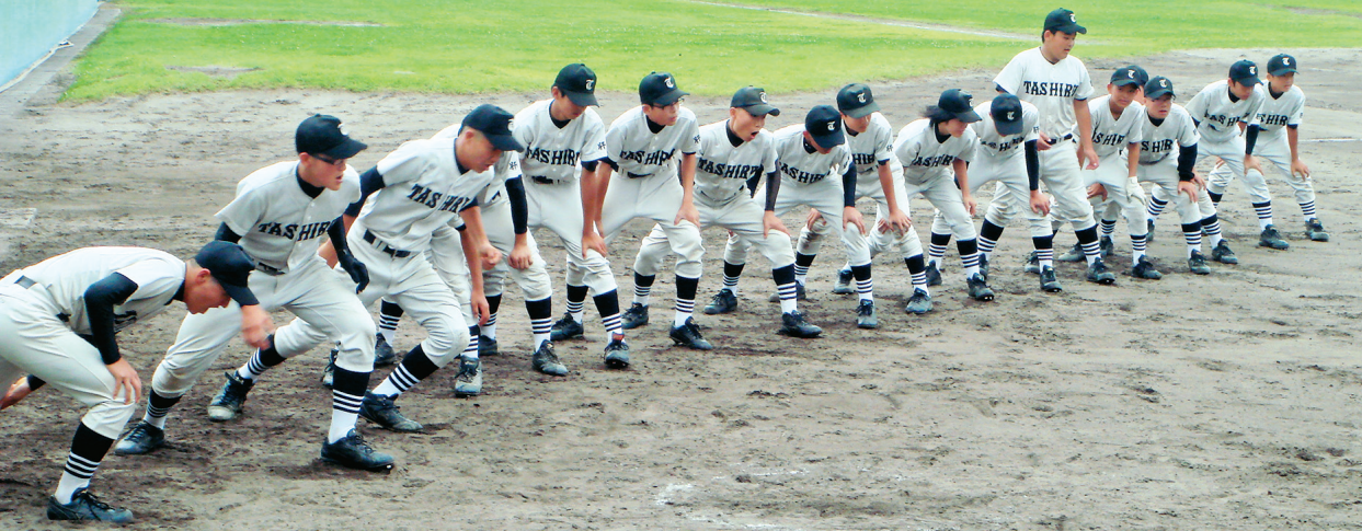
▲ いざ! 出陣!