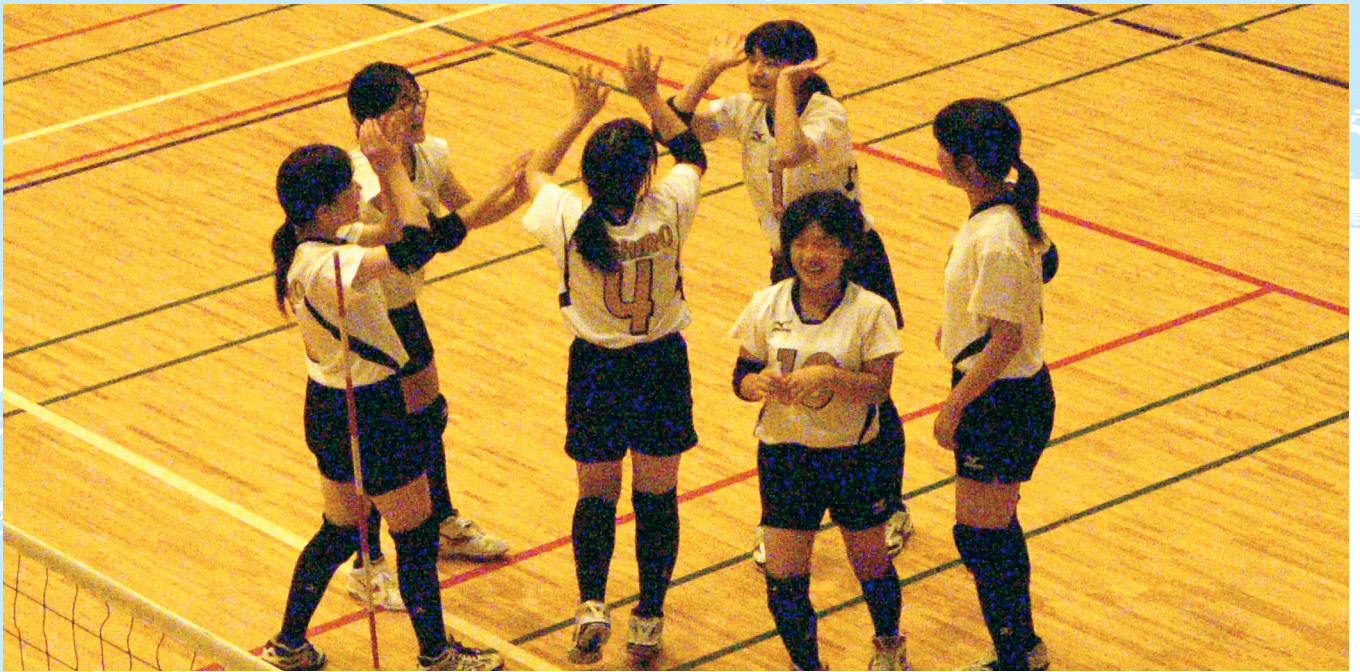
▶ チームの得点に全員で喜ぶ選手たち