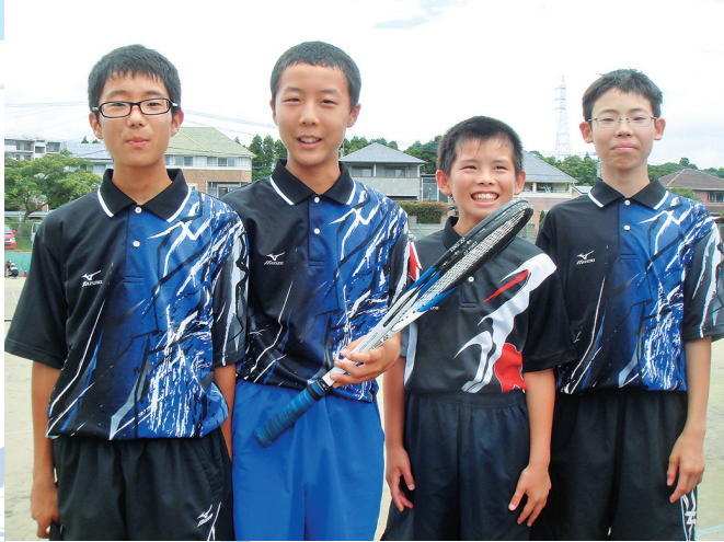
全力で戦った後のすがすがしい笑顔。素敵です。