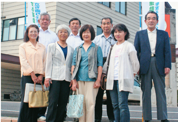
保護司会の皆さん