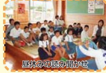
昼休みの読み聞かせ