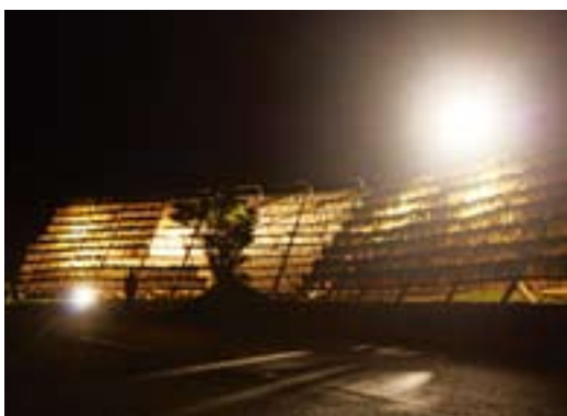
冬空のなかで温かい光を放つ大根やぐら

12月18、19日の両日、宿利原地区の大根やぐらが青や赤などの光に照らされ、神秘的に輝きました。