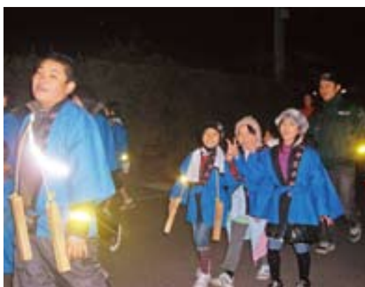
神川中子ども会の夜警の様子

中、子ども達の「火の用心」の元気な声と最近ではなかなか耳にすることのなくなった拍子木の音が街中に響き渡り、地域の方々も、火の用心を再確認する気持ちと、元気をもらったことでしょう。