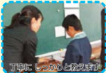
丁寧にしっかりと教えます