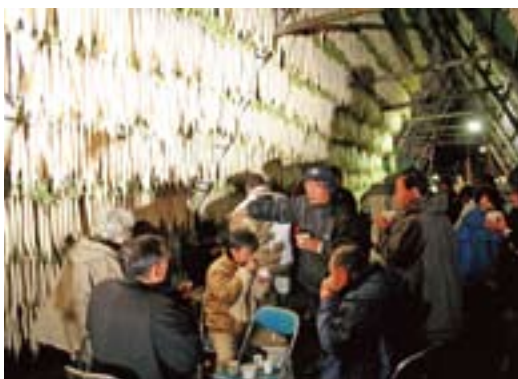
大根やぐらの中で豚汁に舌つづみを打つ来場客