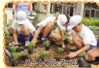
ハートフルタイム