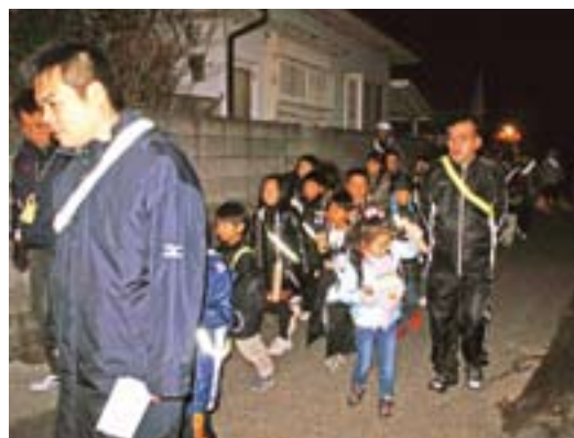
馬場っ子クラブの夜警の様子