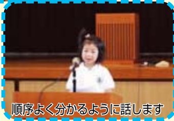
順序よく分かるように話します

話す力・聞く力をつけるために第2・第4水曜日の朝に「きらきらタイム」を実施しています。全校の友だちの前でスピーチするのは緊張しますが確実に話す力が伸びてきました。