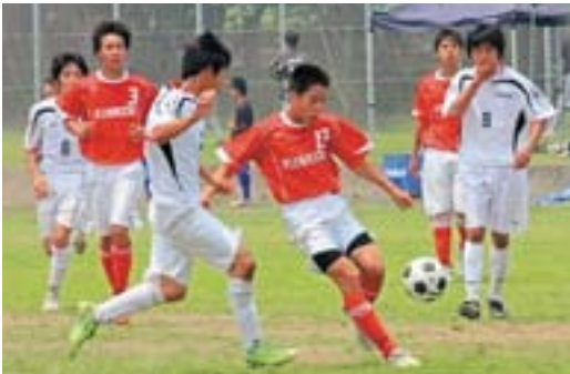
相手ディフェンダーをかわして渾身のシュート