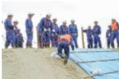
本番さながらの訓練

6月21日、2年ぶりに神之川河口左岸で、消防団・消防署・警察署による合同水防訓練が実施されました。大雨による河川はんらんなどを想定し6つの訓練を実施しましたが、消防団員の迅速な動作により、安全に且つ災害を最小限に抑える工法が行えました。これから、豪雨・台風など災害の発生しやすい時期に入りますので、出水による災害が想定される地域にお住まいの方は、自助の精神で事前に土のう袋などの準備をしましょう。