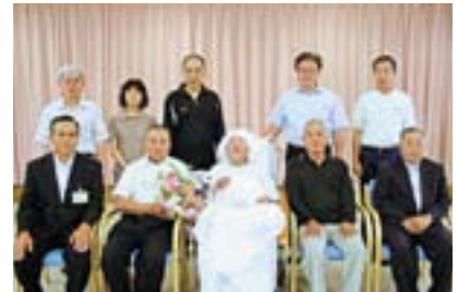
ご家族や職員に囲まれて