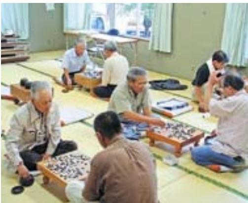
見ごたえある対局の様子