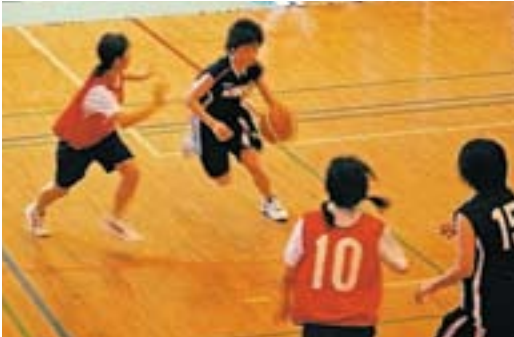
熱気漂う体育館での全力プレー