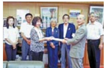
メッセージを手渡す保護司の皆さん

7月2日、保護司会の皆さんが「第59回社会を明るくする運動」月間のPRを兼ねて町長にメッセージを手渡しました。