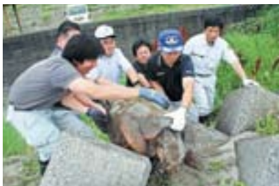
傷つけないように迅速かつ慎重に

神川河岸のテトラポットにウミガメが迷い込んでるとの連絡を受け、役場職員が救出に向かいました。