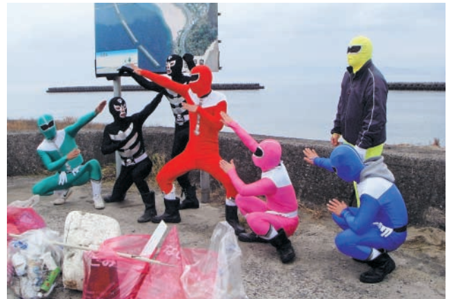
「ごみのポイ捨てやめるんジャー」BY よかふイエロー