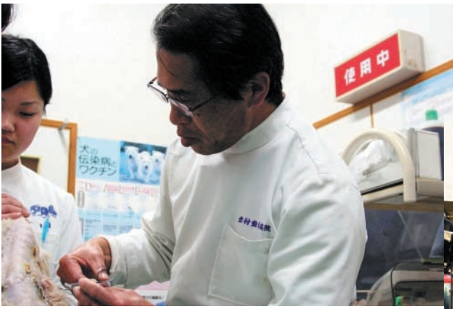
▲優しく語りかけながら治療をする忠和さん