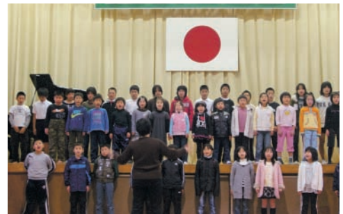
元気いっぱいの子供たちの合唱