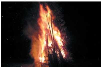
花瀬地区の鬼火焚きの様子