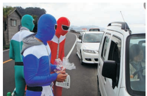
PR活動にも余念がありません。