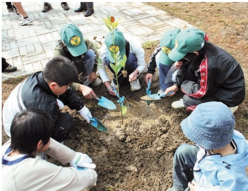
（上） みんなで約500本の植樹