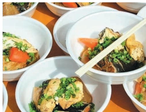
（右） おいしいカンパチ大根