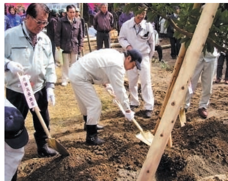
代表者植樹の様子