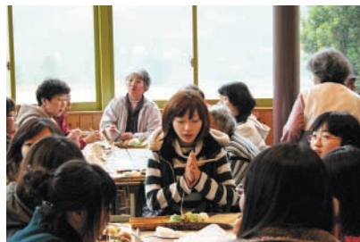
手作りの郷土料理に舌鼓

2月3日(火)に韓国人留学生16名を含む総勢44名が「おいしさ、みどころ再発見ツアー」という企画で本町を訪れ、田代うんめもん会で郷土料理づくりや照葉樹の森で木工体験などを行いました。