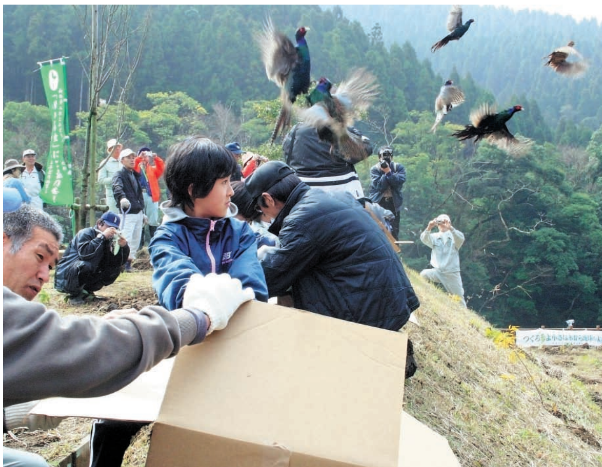
キジの放鳥 (関連記事 2・3 ページ)