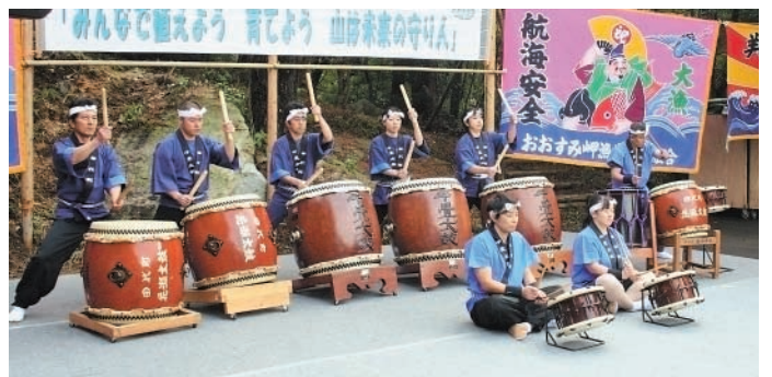
森林にたなびく大漁旗と鼓友会