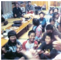
笑っぱなしの参加した子ども達