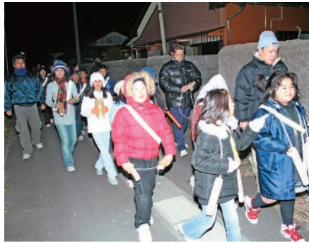
馬場地区子ども会の夜警の様子

12月25、26日に馬場地区子ども会（馬場っ子クラブ）が、12月25日に神川中子ども会がそれぞれ夜警を行いました。