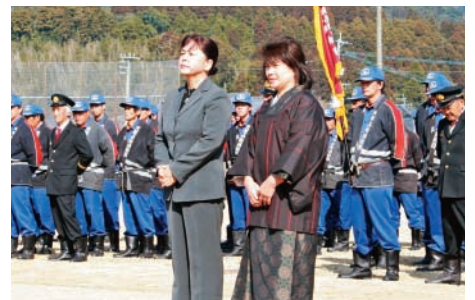
25年勤続妻・家族の表彰