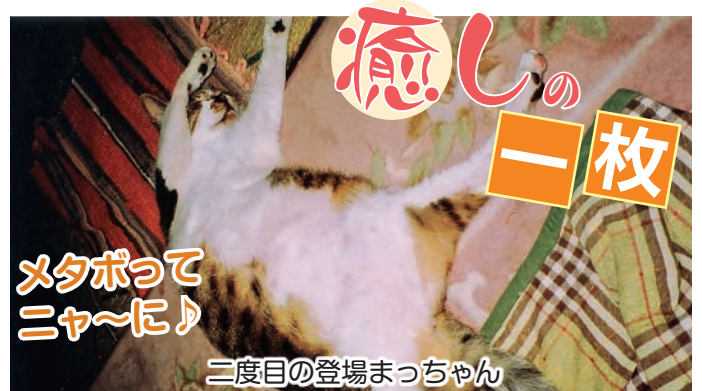
二度目の登場まっちゃん

●「転ばぬ先の杖」インフルエンザが猛威をふるっています。うがい・手洗いやマスクを着けるなど感染を未然に防ぎましょう。 ●年末に生まれて初めてそば打ちをしました。つなぎを使わずにそば粉百パーセントに挑戦しましたが、そばに水を馴染ませる過程を飛ばし、そば粉に水をぶっかけてコネまくりました。結果、両手にはグロームほどのそば粉がついてしまい、出来たそばより洗い流したそばの方が多かったような気がします。でも、味の方は上々でした。 ●気になる一枚の答え。これは近くに公衆電話が設置してあることを示す看板で、現在は公衆電話はなく看板だけが名残として残っています。携帯電話が普及し、公衆電話が減っている昨今、公衆電話を使ったことがない子どもたちもいるかもしれません。