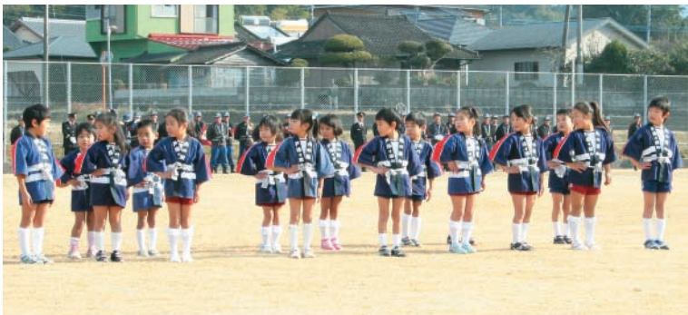
川原幼年消防クラブによる小隊訓練