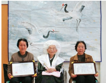
長寿の象徴、鶴をバックに