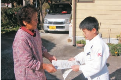
お年寄りに優しく声をかける柔道少年

年の瀬を控えた12月20日に、田代柔道スポーツ少年団の子どもたちが地域の高齢者宅を1件1件訪問し、「おじいちゃん、おばあちゃんが事故や振り込め詐欺などの被害にあわないように」と声かけ活動を行いました。