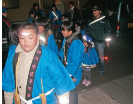
神川中子ども会の夜警の様子