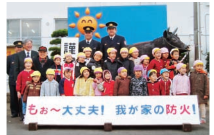
保育園児たちと記念撮影

12月22日、南部消防署の前に2009年の干支である「丑」（牛）がお披露目されました。