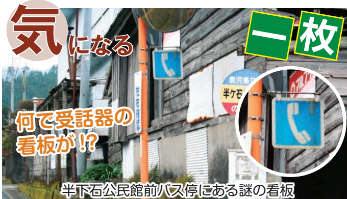
半下石公民館前バス停にある謎の看板

錦江町教育委員会内 「花瀬公園まつり駅伝大会実行委員会」 ☎0994-22-0517 ●0994-25-2515