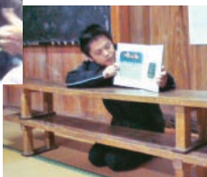
職員による読み聞かせ(右)

本年度より取組を始めた、生涯学習出前講座の1回目を、12月20日に上原公民館で開催しました。今回の講座は上原土曜会から、本の読み聞かせの受講申請を受け、町図書室及び教育委員会から職員が出向き、紙芝居・レクリエーションなどの講座を行いました。子どもから大人まで多数の方に参加していただき、楽しいひと時を過ごすことが出来ました。