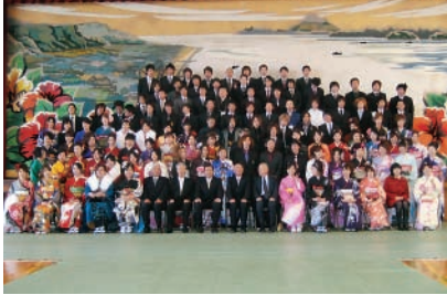
同級生全員で記念撮影